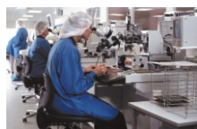
De Forenede Dampvaskerier A/S