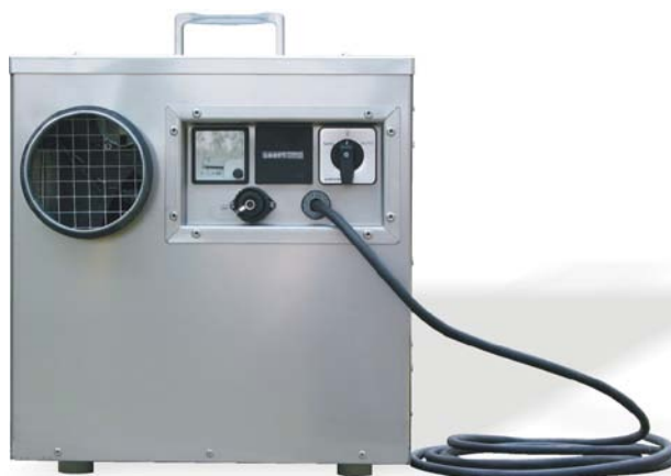
TYP CR120B - CR400B