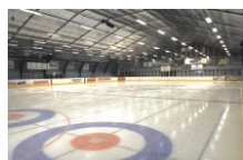
Curlinghalle Gentofte (Kopenhagen)